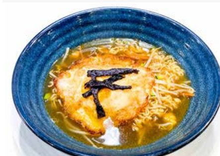
328. RAMEN CON VERDURE E UOVA IN BRODO € 7.50