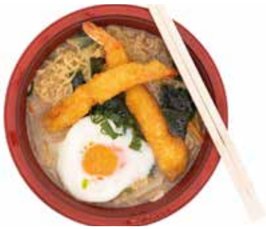
326. RAMEN CON VERDURE E TEMPURA IN BRODO