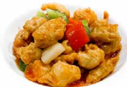
380. POLLO IN SALSA AGRODOLCE