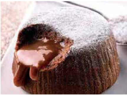
Soufflé al Cioccolato e Caramello 6,00€