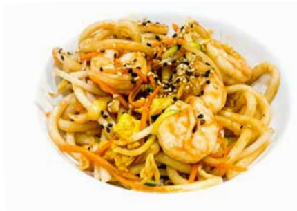
321. UDON CON GAMBERI E VERDURE sesamo, teriyaki, gamberi € 7.00