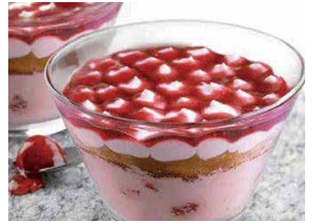
Coppa Cheesecake Monterosa 6,00€