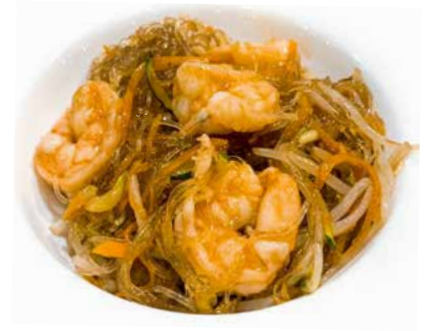
332. SPAGHETTI DI SOIA CON GAMBERI E VERDURE