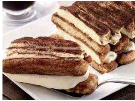
Tiramisù Savoiaridi 6,00€