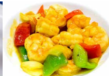
394. GAMBERI IN SALSA CURRY