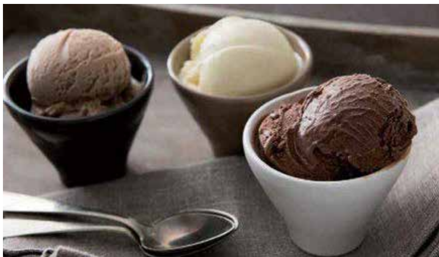
Gelato Normale Al Riso, The Verde, Fragola, Cioccolato, Vaniglia 3,50€