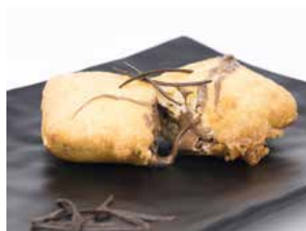
Nutella Fritta 4,50€