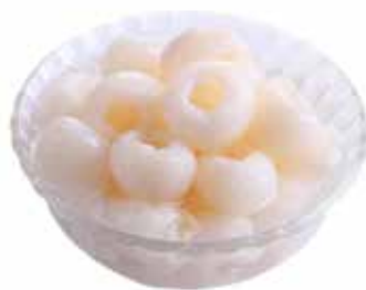
Macedonia Liches 4,50€