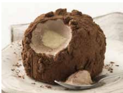
Tartufo Classico 6,00€