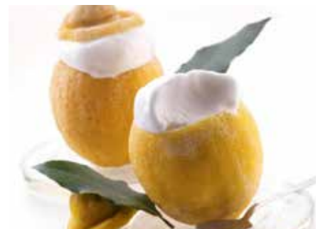
Limone Ripieno 7,00€