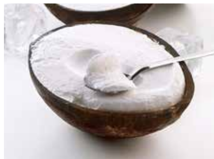
Cocco Ripieno 7,00€