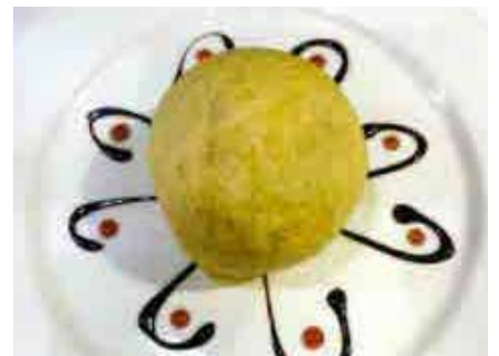
Gelato Fritto 6,00€