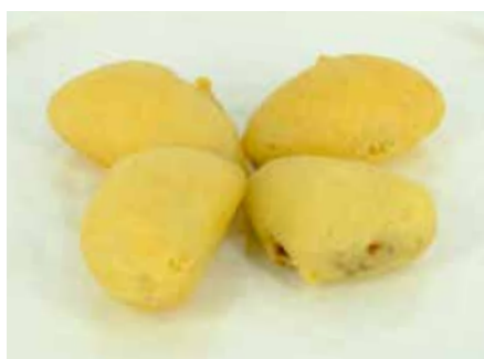
Frutta Mista Fritta 4,50€