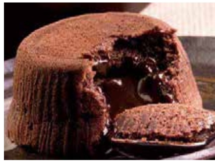
Soufflé al Cioccolato 6,00€