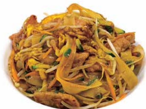
337. PAI THAI CON VERDURE