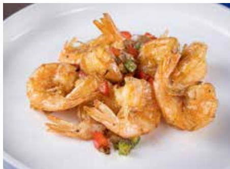
393. GAMBERI IN SALE E PEPE