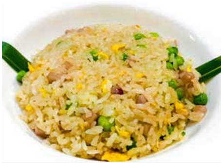
318. RISO CANTONESE prosciutto cotto, piselli, uova € 5.00