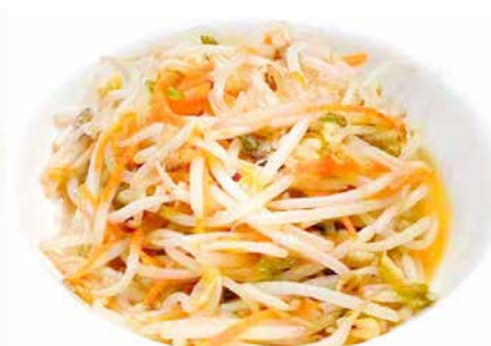
406. GERMOGLI DI SOIA SALTATI