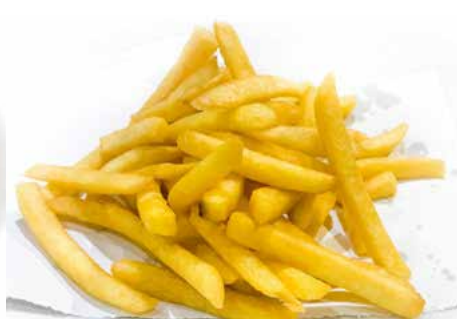
407. PATATINE FRITTE