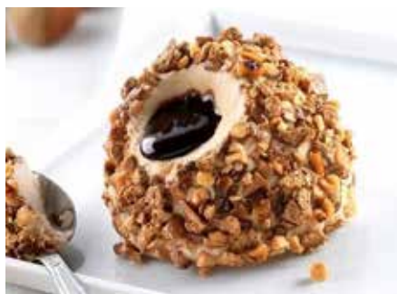
Tartufo Nocciola 6,00€