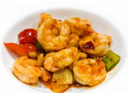
392. GAMBERI IN SALSA PICCANTE