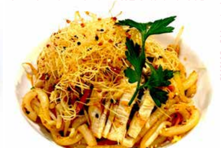
324. UDON CON POLLO E VERDURE sesamo, kataifi, teriyaki € 7.00