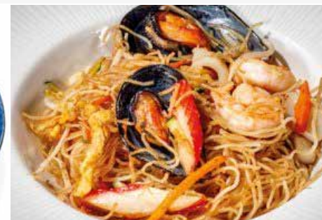
339. SPAGHETTI DI RISO CON FRUTTI DI MARE con frutti di mare e verdure € 9.00