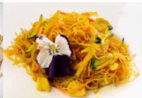
340. SPAGHETTI DI RISO AL CURRY con verdure e curry € 7.00