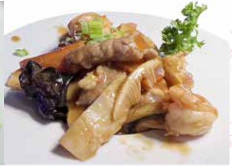
327. RISO CON SOPRA POLLO, GAMBERI E MANZO € 9.00