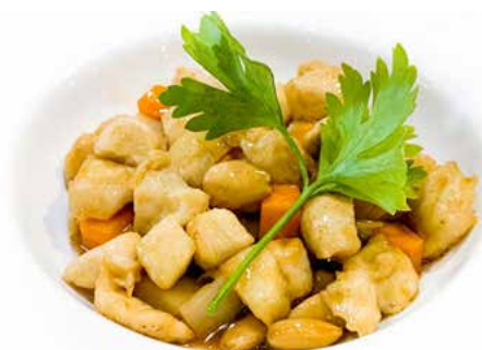
377. POLLO CON MANDORLE