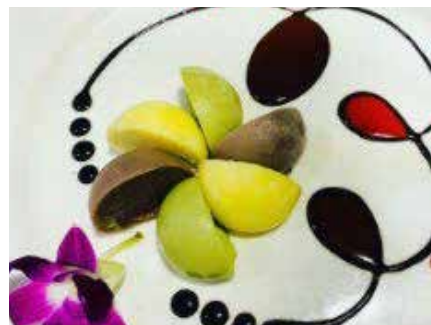
Mochi mango, fragola, vaniglia, sesamo, cioccolato, the verde, cocco 6,00€