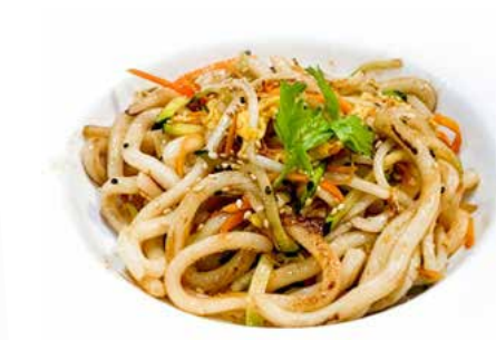
323. UDON CON VERDURE sesamo € 6.00