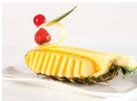
Ananas Fresco 4,50€