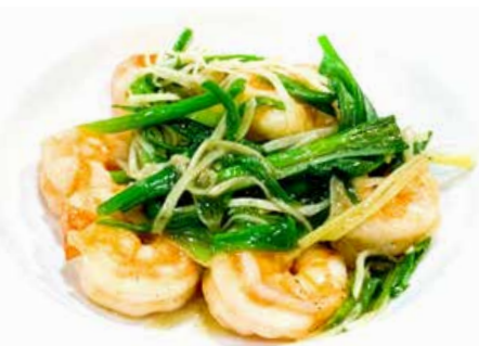
395. GAMBERI CON ZENZERO E ERBA CIPOLLINA