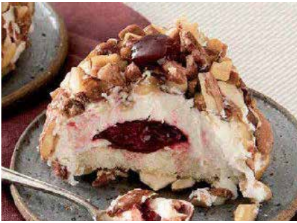
Crocante All'amarena 6,00€