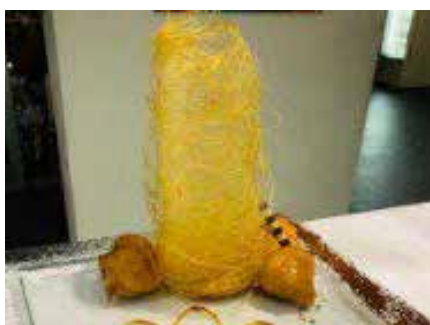
Frutta Mista Caramellata 7,00€