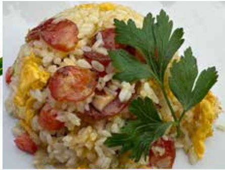
320. RISO SALTATO SALAME CINESE € 6.00