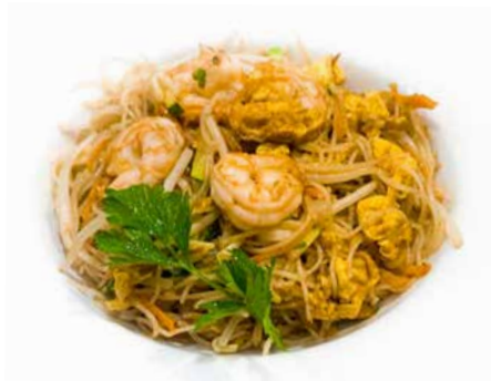
330. SPAGHETTI DI RISO CON GAMBERI E VERDURE