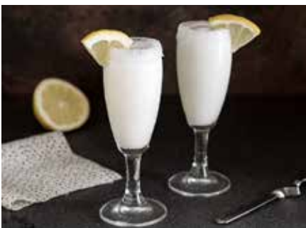
Sorbetto Al Limone 4,00€