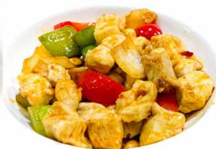
379. POLLO IN SALSA PICCANTE